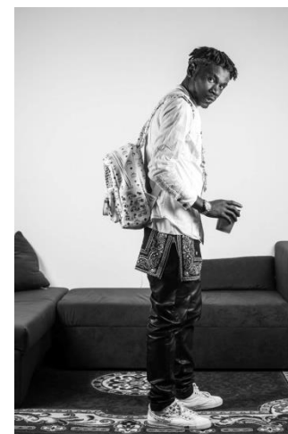
Ariki Boy Afrobeat Klänge aus Belgien