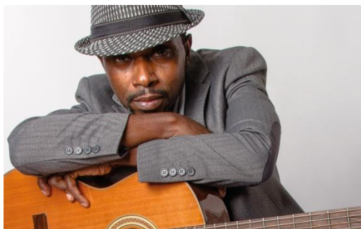
Prince Zeka Kongolesischer Rumba mit modernen Klängen

Dieses Jahr bietet das Festival wieder 3 Tage lang abwechslungsreiche internationale Künstler aus unterschiedlichen afrikanischen Ländern.